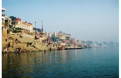
ด้วยได้มีพิธีเผาโรงเรณนมัสการ

05.00 น. อรุณสวัสดิ์ยามเช้ากับเช้าวันใหม่ที่ดีสดใส นำท่านสัมผัสกับความหลากหลายของผู้คนบริเวณ แม่น้ำคงคา ที่ชาวฮินดูเชื่อว่าเป็นสถานที่ศักดิ์สิทธิ์เนื่องจากเป็นจุดที่ดื่มหุงของพระศิวะตกอยู่ใต้แม่น้ำแห่งนี้ ในทางพุทธศาสนาเองเชื่อกันว่าเป็นสถานที่ได้นำพระอัฐิของพระพุทธเจ้ามาลอยอังคารที่แม่น้ำแห่งนี้ เช้า ท่านจะได้นั่งเรือเพื่อไปถวายกระทงเป็นพุทธบูชา ณ ที่นี่เองท่านจะสัมผัสวิถีชีวิตของชาวฮินดูซึ่งจะมาอาบน้ำ ดื่มน้ำรวมทั้งทำน้ำที่นี้จะศพในช่วงเช้าตรู่ก่อนพระอาทิตย์ขึ้น จากนั้นนำท่านเดินทางกลับ เชิญท่านรับประทานอาหารเช้า ณ ห้องอาหารของโรงแรม นำชม สังเวชนียสถานแห่งที่ ๒ สารนาถ สถานที่แสดงปฐมเทศนา สถูปเจาคันธี สถานที่ พระพุทธเจ้าพบปัจฉิมเทศน์หลังจากตรัสรู้แล้ว นำนมัสการ ธรรมเมฆสถูป ที่เชื่อกันว่าเป็นสถานที่ที่พระพุทธเจ้าทรงแสดงปฐมเทศนาหัวข้อธรรมจักกัปปวัตตนสูตรทำให้พระ โภคทัชฌายะบรรลุนิพพาน พระพุทธศาสนาจึงมีพระรัตนตรัยครบ ๓ ประการ แล้วนำชม วิหารมูลคันธกุฎิ หลังใหม่ภายในประดิษฐานพระพุทธรูปปางปฐมเทศนา เลียนแบบคุปตะและจิตรกรรมฝาผนังเล่าเรื่องพุทธประวัติฝีมือช่างชาวญี่ปุ่น แล้วนำท่านชม พิพิธภัณฑสถานแห่งเมืองสารนาถ ชม หีบศพพระเจ้าอโศก ทำเป็นรูปสิงห์บางท่านอธิบายว่าเป็นสัญลักษณ์ของศากยสิงห์พระราชวงศ์ของพระพุทธเจ้า เสามีฐานบัวคว่ำ มีบัลลังก์สี่เหลี่ยมรอบสลักเป็น