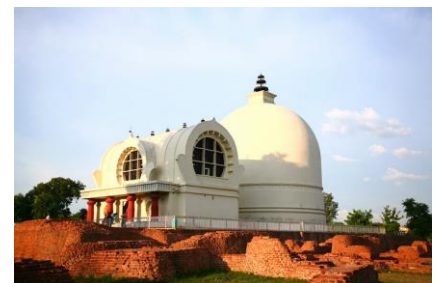
พุทธ เทศนา พระ วิหาร องค์ที่

สถานที่พระพุทธเจ้าเสด็จดับขันธปรินิพพานภายใต้ต้นสาละคู่ เป็นสถานที่พระพุทธเจ้าประทานการบวชให้สาวกองค์สุดท้าย เป็นที่ตรัสปัจฉิมโอวาทสุดยอดแห่งพระธรรมคำสอนคือความไม่ประมาท ชม สถูปปรินิพพาน นำท่านชม พุทธวิหารปรินิพพาน ซึ่งภายในพระเป็นปฏิมากรรมพระพุทธรูปปางปรินิพพานเป็นสัญลักษณ์ของพระพุทธ