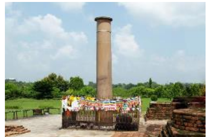
เจ้าชาย ในเขต ห่างจาก

เที่ยง เชิญท่านรับประทานอาหารกลางวัน ณ ห้องอาหารของโรงแรม