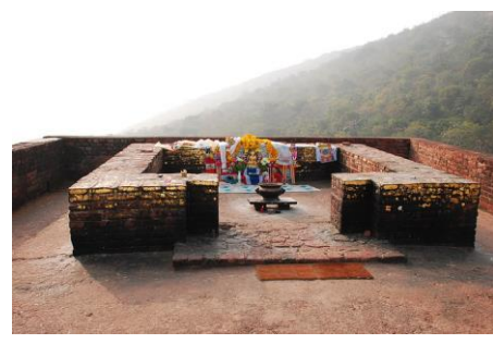
แห่งแรก ภัจจ์ อูทิส เหลือซาก กระแตก

นำท่านเดินทางสู่ เมืองราชคฤห์ นครหลวงแห่ง แคว้นมคธ นำท่านเดินขึ้น เขาคิชฌกูฏ หนึ่งในเบญจคีรี ได้แก่ เว ภาระ เวปุละ คิชฌกูฏ อีสิลิถิ และปัททวะ ชมวิวทิวทัศน์ที่สวยงาม นมัสการ ถ้ำพระโมคคัลลา ชม ถ้ำพระสารีบุตร สถานที่ที่พระสารีบุตรสำเร็จเป็นพระอรหันต์ ชม กุฏิของพระอานนท์ นมัสการ มุลคันธกุฎี สถานที่ประทับของ พระพุทธเจ้า จากนั้นนำท่านชม วัดชีวกัมพวัน โรงพยาบาลสงฆ์ ของโลก “ชีวกัมพวัน” เป็นสวนป่ามะม่วงที่หมอชีวกโกมาร ถวายเป็นสังฆารามแด่พระพุทธเจ้าและพระภิกษุสงฆ์ ปัจจุบัน โบราณสถานให้เห็นเป็นซากหินเรียงรายกันอยู่ เมื่อครั้งที่ พระพุทธเจ้าทรงประชวรหือพระโลหิตจากการที่สะเก็ดหินมา ถูกพระบาทเพราะพระเทวทัตกลิ้งหินลงมาหมายปลงพระชนม์ พระพุทธเจ้า พระภิกษุสงฆ์ได้พาพระพุทธองค์มาที่ชีวกัมพวัน และหมอชีวกเป็นผู้ถวายการรักษาโดยการผ่าตัดเอา สะเก็ดหินออก ชีวกัมพวันจึงถูกเรียกว่า เป็น โรงพยาบาลสงฆ์แห่งแรกในพระพุทธศาสนา นำท่านเดินทางสู่ วัดเวฬุ วนารามมหาสังฆนิกาวาส (วัดเวฬุวัน) วัดแห่งแรกในพระพุทธศาสนาและเป็นสถานที่แสดงโอวาทปาฏิโมกข์แก่พระ อริยสงฆ์ 1,250 องค์ มีสถูปที่บรรจุพระอัฐิธาตุของพระโมคคัลลานะและพระอัญญาโกณฑัญญะ