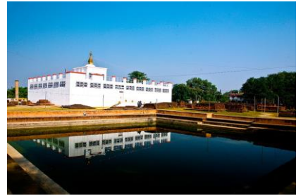
เจ้า พุทธ ตำคัญที่ สถาน มายา